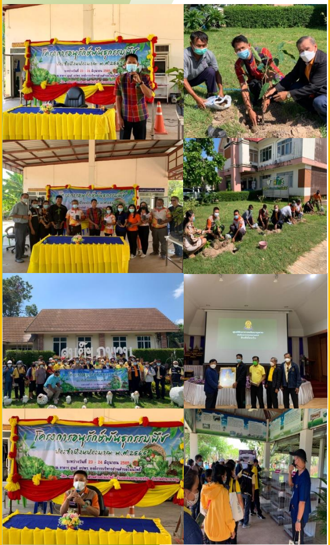
23-24 มิถุนายน 2565 องค์การบริหารส่วนตำบลโนนโพธิ์ ได้จัดการอบรมและศึกษาดูงานโครงการอนุรักษ์พันธุกรรมพืช ประจำปี 2565